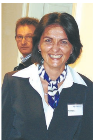
Ein Lächeln für die Kamera trotz hohem Konzentrationsfaktor über Stunden.