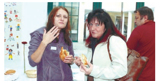
Kaffeepausen brauchen Unterstützung aus den Vitrinen der Konditoren.