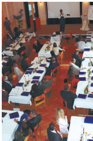
Der Saal des Reichensteinerhofes lieferte eine stilvolle Atmosphäre.

POYSDORF. Es war das Gemeinschaftswerk dreier Banken des Volksbank-Verbundes: Die Volksbank Donau-Weinland, Volksbank Obersdorf-Wolkersdorf und die Weinviertler Volksbank luden ihre Kommerzkunden nach Poysdorf in den Reichensteinerhof, um im Rahmen von Fit for Business an ihrem Unternehmen zu arbeiten.