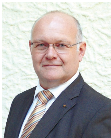
Dir. Michel Peschka lud seine Kommerzkunden nach St. Marienkirchen.